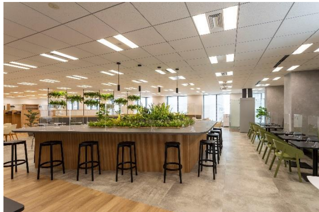
<明るく開放的な休憩室>