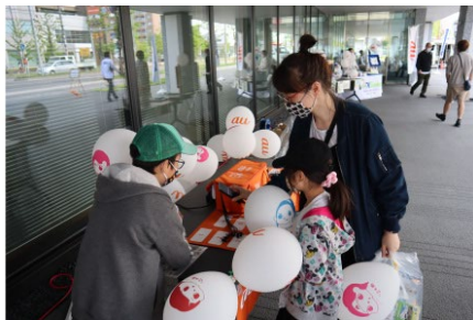
<親子で参加、災害時に役立つ「ランタン工作」 / 停電時に利用できるスマホ充電ブース体験>

●【もしもの備え 4 選】災害対策フェスタの開催レポートで見る防災～公開中 https://www.k-evolva.com/blog/detail20220601.html