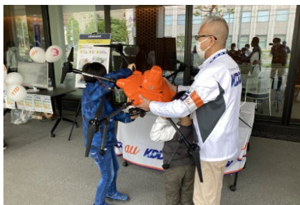
<衛星回線システム搭載の車載型基地局 / 災害時空撮ドローン“持ち上げてみようチャレンジ”>