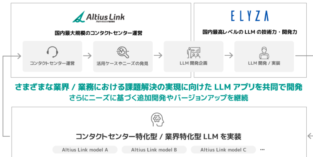
<2 社による LLM 開発プロセス>

アルティウスリンクと ELYZA は、両社の協業形態についてさらに検討を進め、生成 AI 活用×オペレーション力を通じてお客様企業の業務改革、BX 実現を支援し、お客様企業とともに新たな顧客体験を創造してまいります。