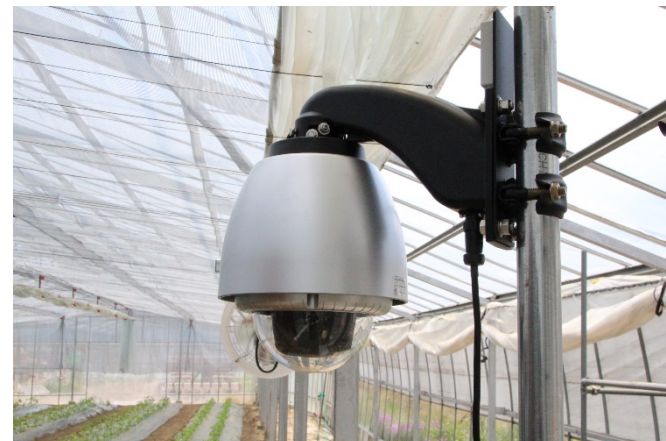
＜屋外クラウド録画パッケージ＞