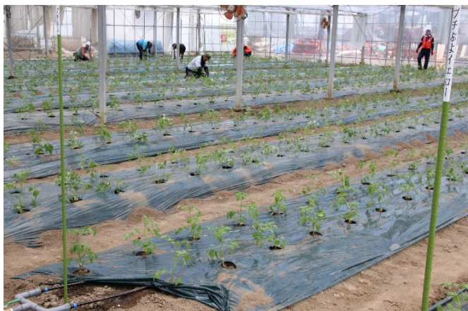
＜幸 満つる 郷 KDDI エボルバ 野蒜 ミトマト圃場の様子＞