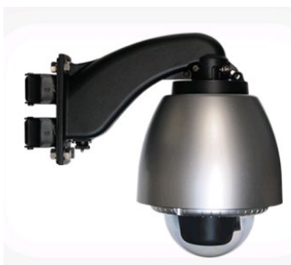
<屋外クラウド録画パッケージ>

録画データはクラウドに保存されるため、録画機器が不要です。さらに、万が一のトラブルでもデータが失われることはありません。