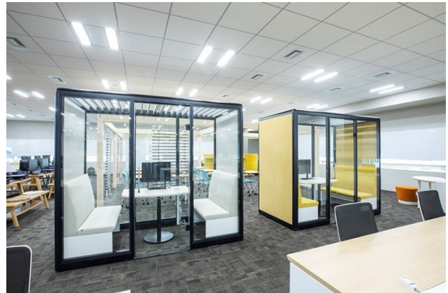
<明るく、解放感にあふれる運用室>