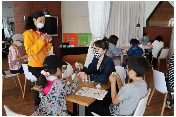
<地域住民への充電ブース開放/KDDI 共催・札幌市後援の防災イベント>