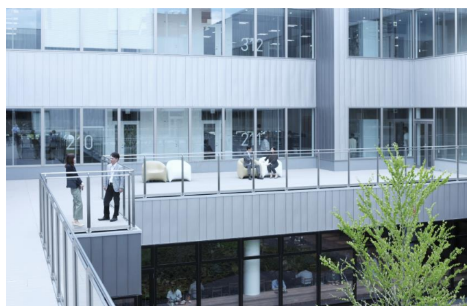
<中庭を中心に“内に開く”設計で、機密性と快適性を実現>