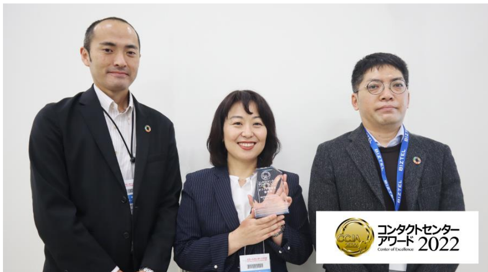
<11月10日開催 表彰式 CRM デモ&コンファレンス in 東京>

KDDI エボルバは、今後も全国 40 拠点の BPO・コンタクトセンター運営、『多様な人材×多様な働き方』を追求した社員の働きやすい環境整備、クライアント企業様の事業成長や社会に貢献する活動に取組み、持続的成長の実現を目指してまいります。