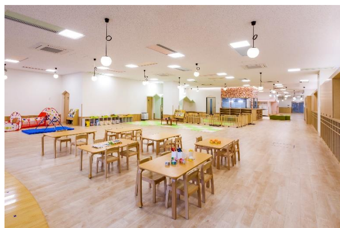
<300 席以上の社員カフェテリア/センター併設の企業主導型保育園「こどもカンパニー」 >