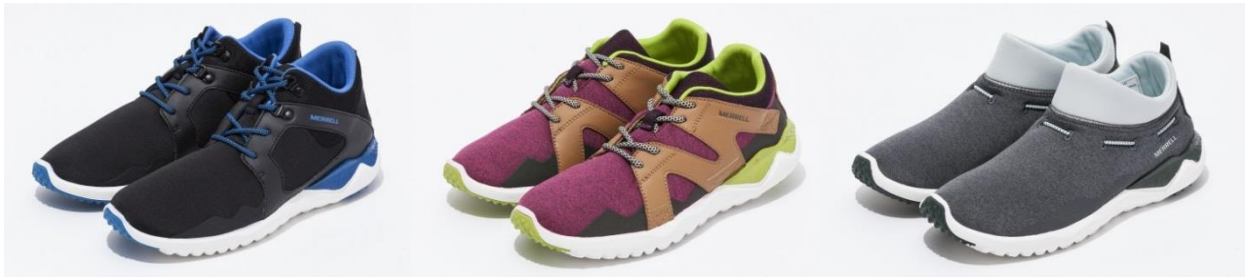
写真左から 1SIX8 MID、LACE、MOC (for WOMEN)