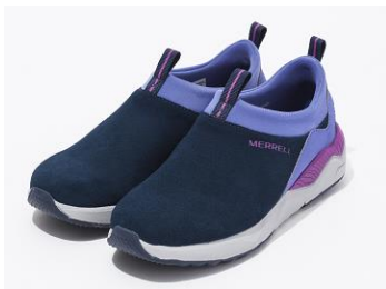
「1SIX8 MOC」(for KID'S)