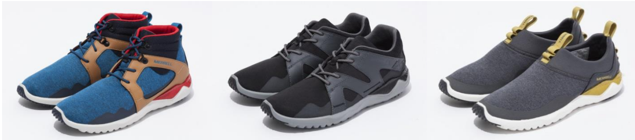
写真左から 1SIX8 MID、LACE、MOC (for MEN)

世界 160 カ国で愛用される米国アウトドアブランド MERRELL (メレル、輸入総代理店：株式会社丸紅フットウェア) は、2016 年 FW の“アクティブ ライフスタイル”ラインの新商品として、今シーズン最軽量を実現したオールラウンドシューズ、「1SIX8」シリーズ 3 タイプ (MID、LACE、MOC) を、8 月下旬より発売いたします。価格はメンズ、ウィメンズともに、「1SIX8 MID」が 14,000 円 (税抜)、「1SIX8 LACE」が 13,000 円 (税抜)、「1SIX8 MOC」が 12,000 円 (税抜)。キッズ向け「1SIX8 MOC」が 5,800 円 (税抜) です。全国のメレル取扱い店および直営店、メレル公式オンラインストア ( http://merrell-online.jp/ ) にて販売します。