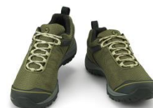
カメレオン 5 ストーム ゴアテックス®