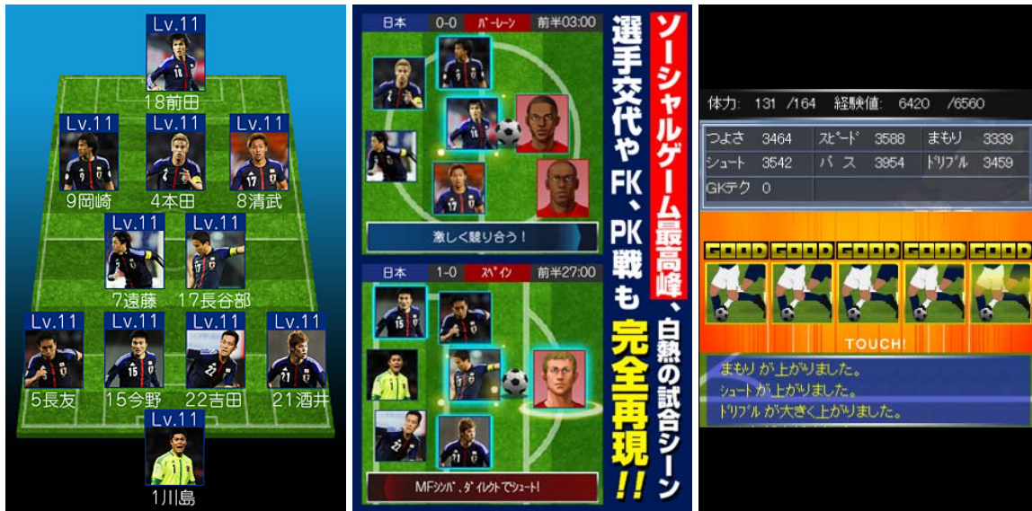
※リリースに登場するサッカー日本代表選手 11 名は 2012 年 11 月代表戦のスタメンです。