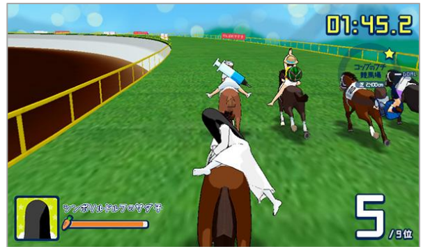
貞子の怨念注入で“最恐ジョッキー”に！

日本中央競馬会は、来る5月29日（日）に東京競馬場で開催する日本ダービーに向け、健気な表情と佇まいで人気のカプセルトイ「コップのフチ子」とスペシャルコラボレーションしたWEBコンテンツ『お馬のフチ子と日本ダービー』を公開しております。この度、5月28日（土）から6月26日（日）までの期間限定で、リアル「お馬のフチ子」プレミアムフィギュアを東京競馬場にて販売することが決定いたしました。