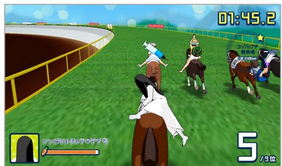
日本ダービーに、貞子が緊急参戦!?