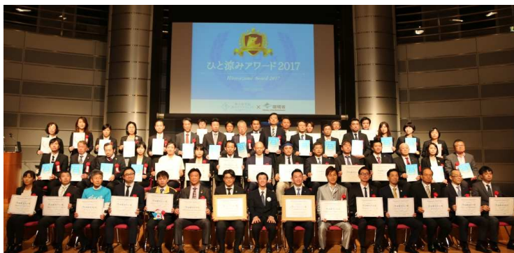
「ひと涼みアワード2017」表彰式