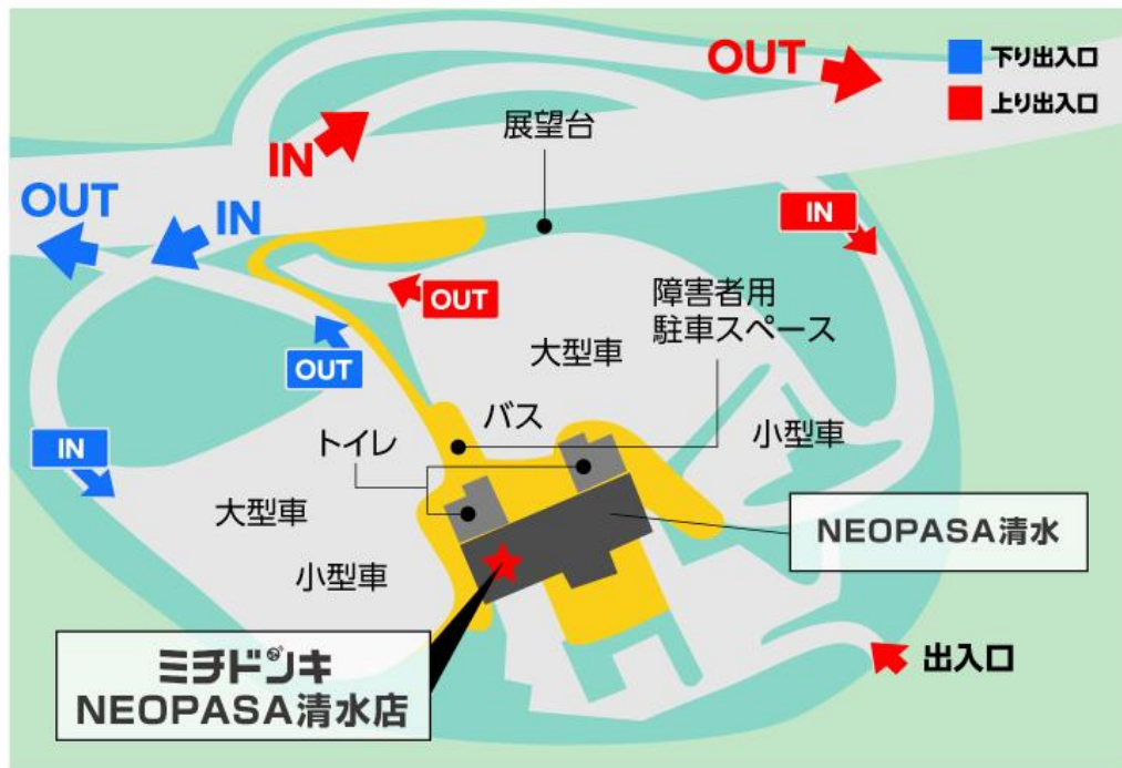
【NEOPASA 清水周辺マップ / 施設内出店エリア】

名 称：「ミチドンキ NEOPASA 清水店」 営 業 時 間：午前9時～午後9時 所 在 地：静岡県静岡市清水区小河内 885-15 開 店 日：2018年10月6日（土）午前9時 売 場 面 積：113.5 m 2 建 物 構 造：鉄骨造 地上1階 商 品 構 成：青果（フルーツ）、お菓子、冷凍食品、珍味 他 駐 車 台 数：307台（NEOPASA 清水敷地内駐車台数）