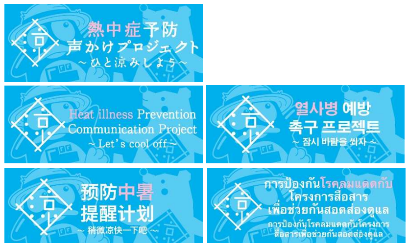
ホームページ掲載 動画リンクバナー