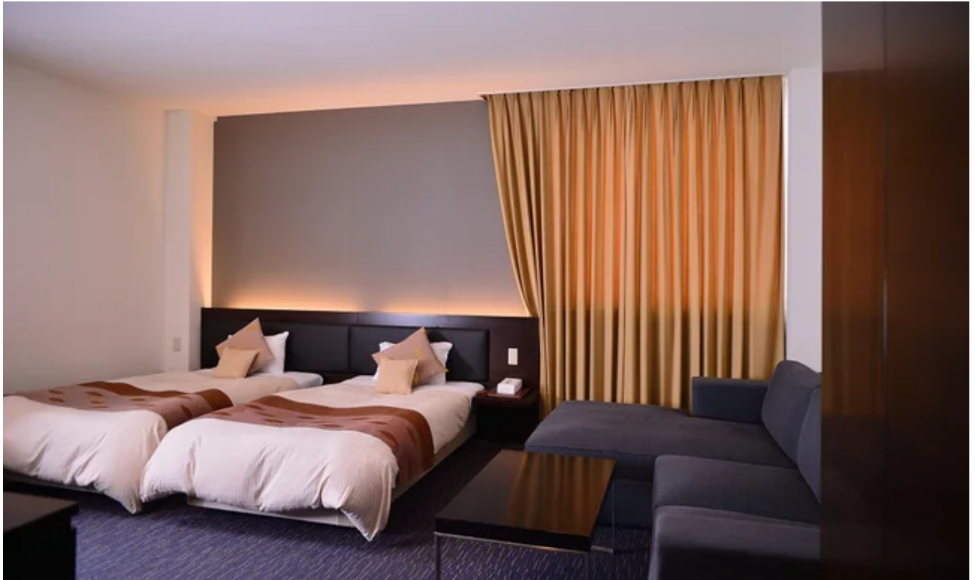
室蘭プリンスホテル DXツイン

冬から春にかけてのビジネスホテルステイは、季節を問わず快適にお過ごしいただける環境が整っています。