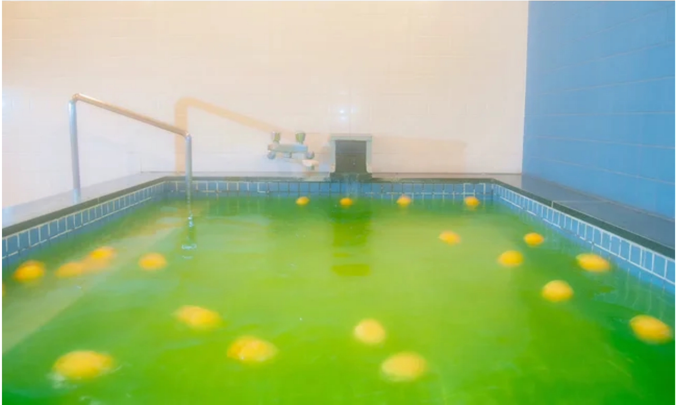
第二プリンスホテル室蘭ビュー トゴールの湯 浴場

室蘭プリンスホテル、第二プリンスホテル室蘭ビュー、新苫小牧プリンスホテル「和～なごみ～」では、日ごろのご愛顧に感謝を込めて、公式ホームページ限定のお年玉クーポンを発行いたします！ 冬～春の旅をリーズナブルに楽しみたい方や、室蘭や苫小牧の観光スポットを満喫したい方、年明けの出張宿泊先をお探しの方はぜひ野口観光グループ公式ホームページよりご予約くださいませ！ リーズナブルに旅に出かける絶好のチャンスです♪