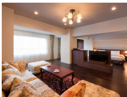
大正ロマン客室※タイプは選べません