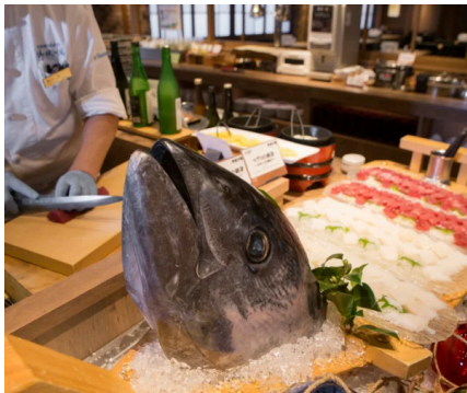
さばきたてのお刺身を楽しんだり