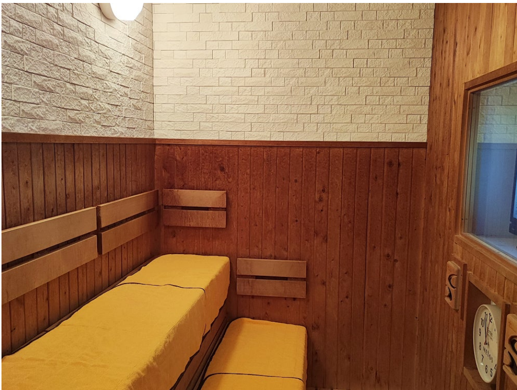
大浴場にはサウナもついています♪