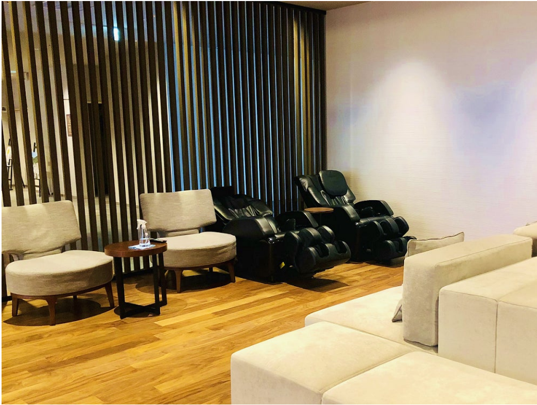
入浴後はもちろん、出発前などにもゆったり過ごせるラウンジ