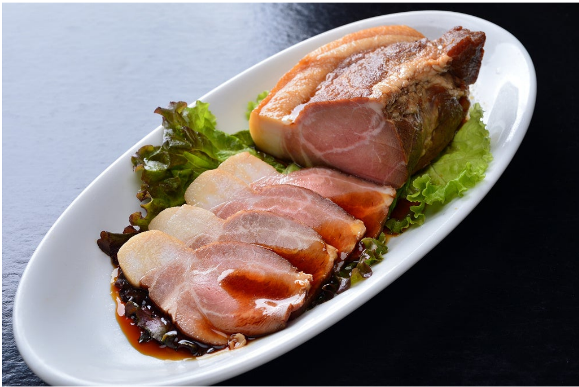
室蘭プリンスホテル特製てづくりチャーシュー