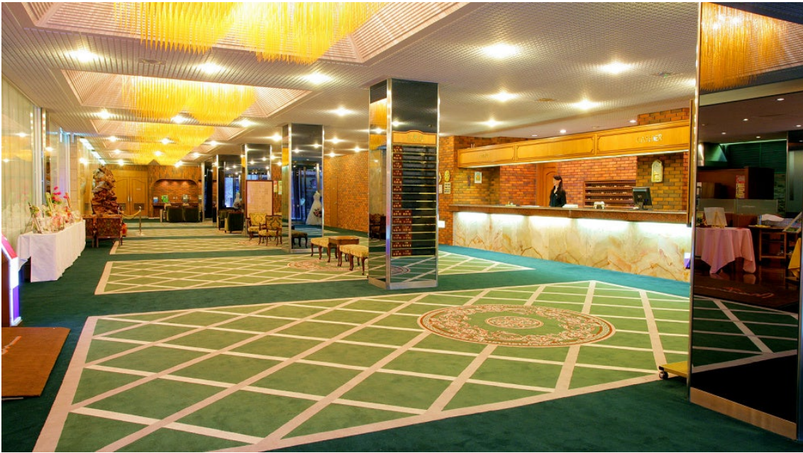
おせち料理のお渡しはフロントにて。当日はチャシュー販売もいたします！