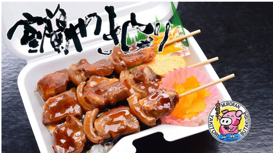
室蘭のご当地グルメ室蘭焼き鳥が載ったお弁当

さらに、室蘭ならではの美味しいご当地グルメをホテルでお楽しみいただける宿泊プランも新登場！ 北海道室蘭市で考案された「室蘭焼き鳥」は、豚肉とたまねぎを交互に串にさした串焼き料理で、甘みのあるタレと洋辛子をつけて食べるのが定番。