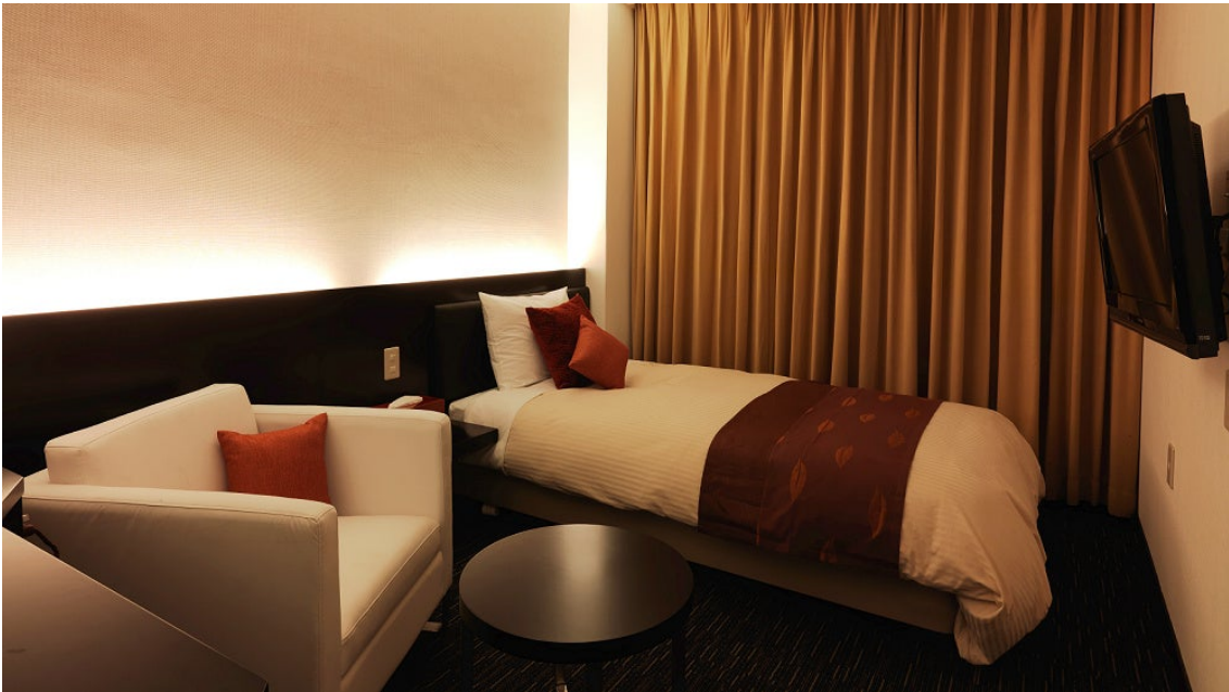
シングルルームにもテーブルセットがあるので、夕食を食べるスペースとしてご利用いただけます