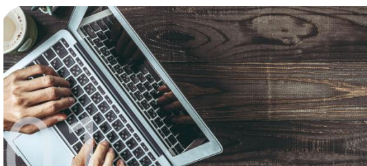
ストレスチェック『Co-Labo』

ストレスチェックの導入から職場環境改善コンサルティング、面接指導をおこなう医師のご紹介まで、ご要望にあわせてトータルにサポートいたします。