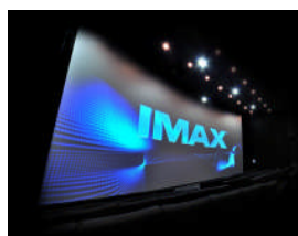
デュアル・プロジェクター・システム

IMAX® デジタルシアターは、映像、映写機、劇場デザイン、音響システムすべてに独自の技術を採用しています。2台のプロジェクターによって投影されるクリアで明るい映像と、パワフルなデジタル・サウンド、劇場に合わせたシアター設計によって、観客の視野を最大限に高め、まるで映画の中にいるような臨場感溢れる映像体験が可能です。また、日本でも本格的に普及が進む3D 映画にも対応。オリジナル技術の IMAX® 3D と、大きく広がった視野で体験いただく映像は、スクリーンから観客のひざの上まで飛び出してくるような迫力が味わえます。