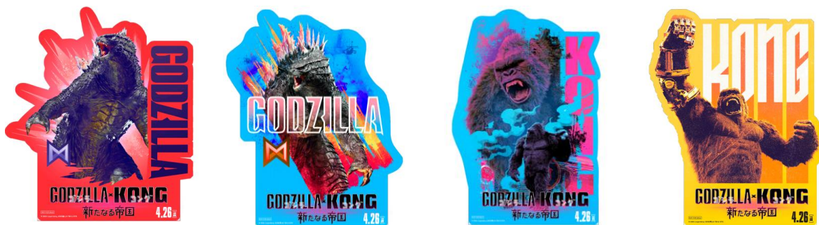
映画『ゴジラ x コング 新たなる帝国』オリジナルステッカー4種