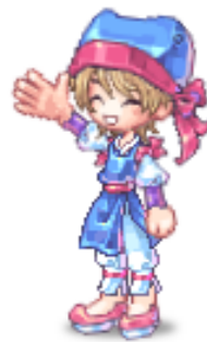
PC 連動アイテム 「ドリームカジュアル衣装セット」