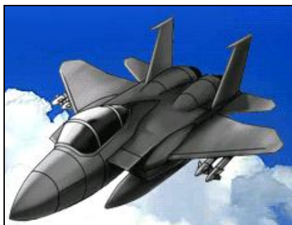
E-15 戦闘機を撃墜しろ！

任務部隊を使って任務を進めます。任務を進めると経験値があがり、レベルアップします。エリア内の任務をすべて終了すると敵が出現し、撃退すると強力なアイテムが手に入ります。