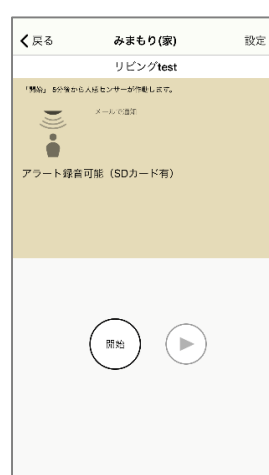
見守りモード設定画面