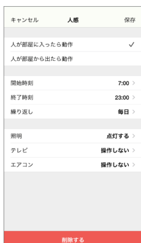
人感センサーでの家電操作設定画面

「見守りモード」はタイマー設定が可能なため、毎日の外出時間に合わせて、自動で家の安心を守る事が可能です。