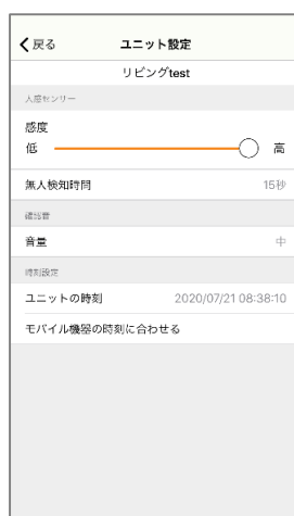
人感センサー感度設定画面