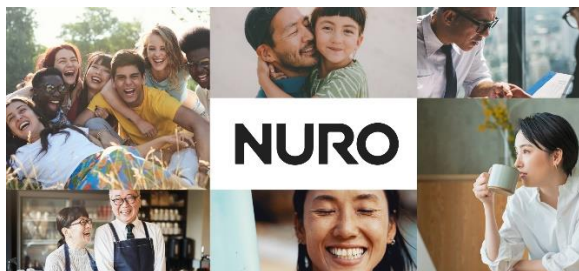
“先進性×親しみやすさ”を表現