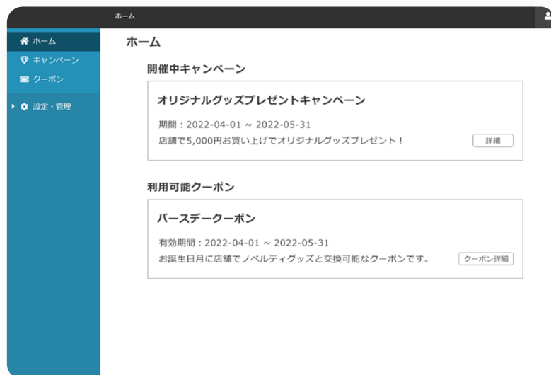
マイページホーム画面

また、会員向けマイページも自動生成され、ユーザーは対象のキャンペーン・クーポンの確認や利用が可能です。