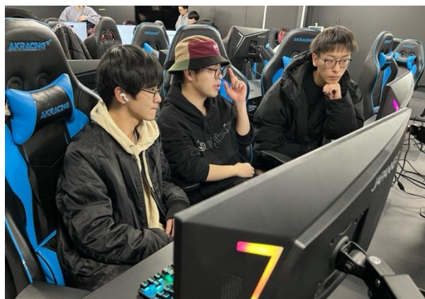
各チームでプレストしながら企画を立案