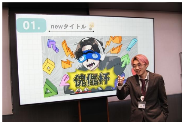
最終審査を通過した「傀儡杯」のプレゼンテーション