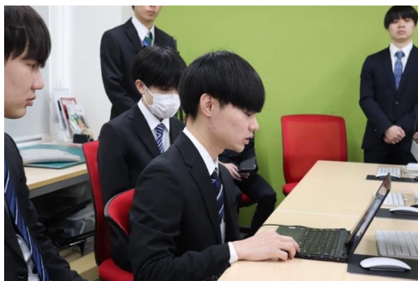
オンラインでプレゼンテーションに挑む様子