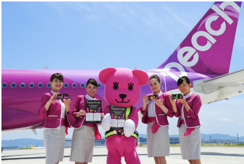
【機内用リーフレット・SIM パッケージを持つ Peach 客室乗務員と So-net キャラクターのモモ】

ソネット株式会社(以下 So-net)は、Peach Aviation 株式会社(以下 Peach)と訪日外国人の利便性向上を目指し、関西国際空港到着便の Peach 機内にて、プリペイド式 SIM で日本国内での LTE 高速モバイルデータ通信サービスを手軽に利用できる『Prepaid LTE SIM』の販売を、7月15日より開始いたします。国内発行プリペイド SIM において、国際線定期便を運航する日系航空会社での機内販売は、日本初となります(*1)。