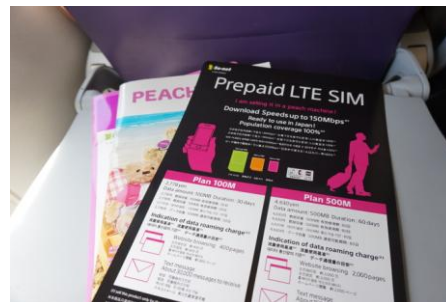
【機内用リーフレット：日本到着前に通信手段を手軽に検討・確保できます】