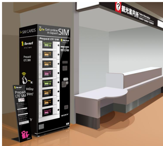
【設置イメージ図: 1F 到着ロビー国際線出口前・観光案内所横の便利なロケーション】

このたびの『Prepaid LTE SIM』販売は、こうしたニーズに応えるもので、多くの旅行者の拠点となる那覇空港での自販機設置により、沖縄を訪れる外国人旅行者のインターネット接続環境がさらに便利になります。なお、日本の国際空港におけるプリペイド式 SIM の自販機設置は、今年4月の関西国際空港、12月の仙台空港に続く3例目となります。