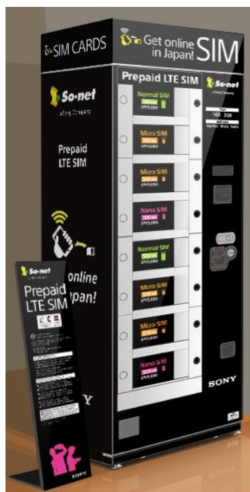
【自動販売機 イメージ図】