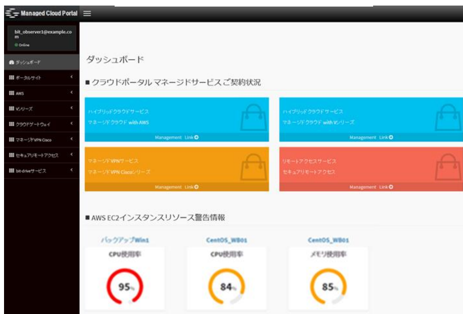
■ポータルサイト管理画面

AWSやVシリーズを統合管理できるポータルサイトを提供します。サーバの運用監視、バックアップの自動化やリストア復旧など、複雑なコンソールを操作しなくても、手軽にAWSや専有型VMware vSphere環境を利用した「ハイブリッドクラウド」を運用管理することができます。また、VPNサービスやその他「bit-drive」のアプリケーションサービスも同ポータルサイトで連携することで、企業インフラの運用管理の効率化が実現できます。