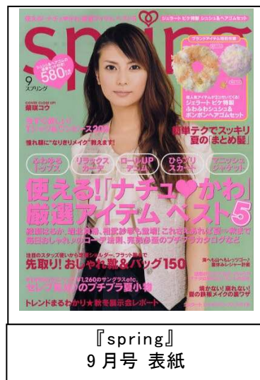
『spring』 9月号 表紙