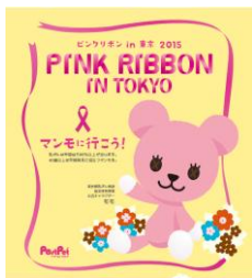
トレインチャンネル

路線: JR 中央線快速、京浜東北線・根岸線、埼京線の女性専用車両 期間: 10月5日(月)~10月11日(日)(終日)