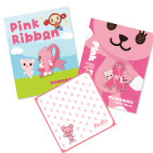
ピンクリボンバッジとミニハンドタオル

ピンクリボンフェスティバルでは、モモデザインピンクリボンバッジ(2種)、ミニハンドタオル、台湾 Sony Pink Ribbon グッズをイベント会場で販売します。収益の一部はピンクリボン活動に使われます。