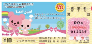
第2296回 東京都宝くじ「ピンクリボンin東京2015」