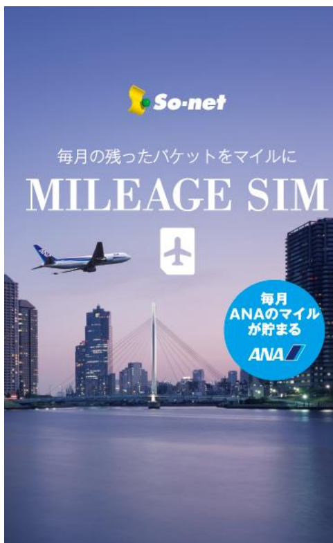
【パッケージ画像(イメージ)】

『MILEAGE SIM』は、通信サービスの利用期間中、毎月 ANA のマイルが 20 マイル貯まる上、月間データ通信容量内で利用せずに残ったパケットデータ 300MB ごとに、10 マイルが貯まる(*1)、お得な SIM サービスです。