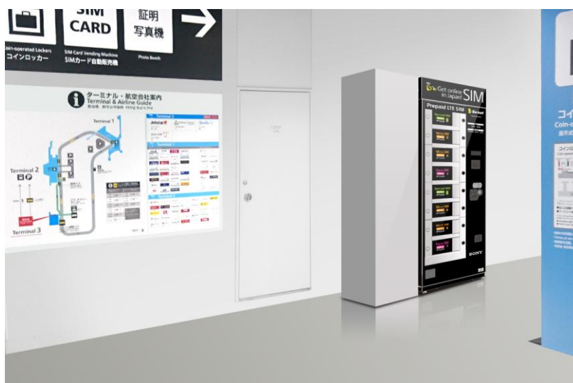
【設置イメージ図：成田国際空港 第3旅客ターミナル本館 2階】

多くの旅行者の窓口となる、成田国際空港での自販機設置により、日本を訪れる外国人旅行者のインターネット接続がさらに便利で快適になります。