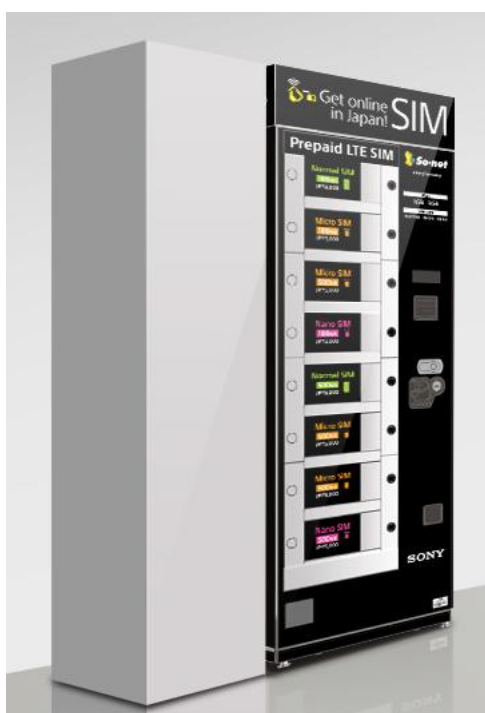
【自動販売機 イメージ図】