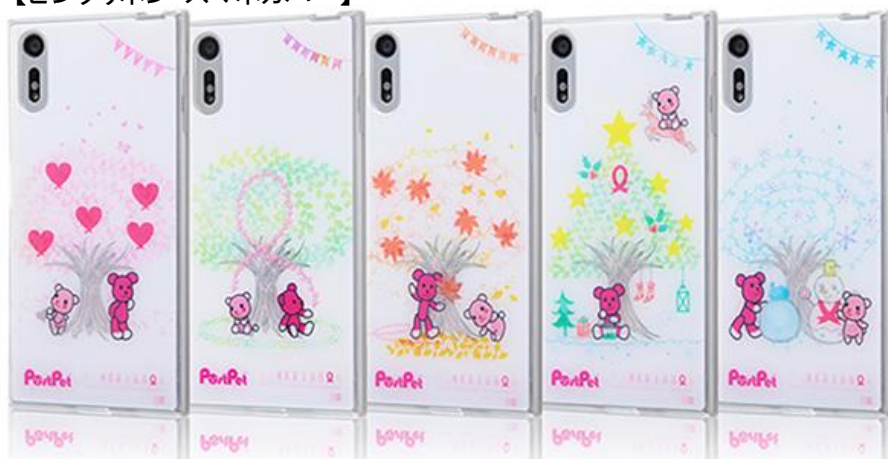
通常デザイン(Xperia™、iPhone 対応)