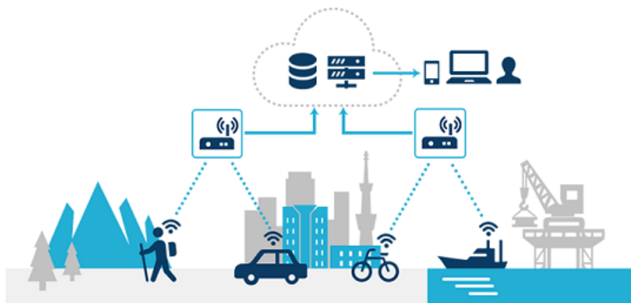
ELTRES™ IoT ネットワークサービスの活用イメージ

・ELTRES™ IoT ネットワークサービス公式サイト: https://iot.sonymnetwork.co.jp/service/eltres/