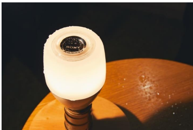
防水性能を備えた LED 電球スピーカー「LST-SE300」

ソニーネットワークコミュニケーションズ株式会社は、電球とスピーカーを一体化し Bluetooth®でワイヤレス再生ができる LED 電球スピーカーの新モデル「LST-SE300」を 4 月 30 日に発売します。新モデルでは、新たに防水性能を搭載し、ベランダやテラス、キャンプなど、これまでスピーカーを設置しにくかった場所やシチュエーションでも音楽を楽しむことができます。