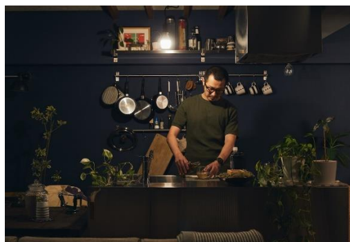
キッチン (ペンダントライト)