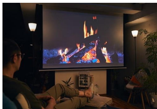
リビング (フロアスタンド 2 台設置)