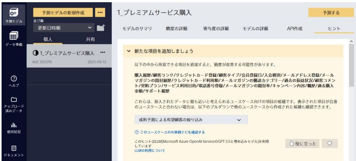
イメージ図:ユーザーが投入したデータに基づき精度改善のヒントを提示

ソニーネットワークコミュニケーションズ株式会社は、AI 予測分析ツール「Prediction One(プレディクション ワン)」において、予測分析の精度向上のために、ユーザーへ改善方法を提案するヒント機能に生成 AI を用い、機能強化を行いました。今回のアップデートにより、ユーザーが投入したデータに基づいてヒントを提案できるようになり、従来の機能よりもユーザーニーズに沿う、カスタマイズされた改善方法を提示します。ユーザーは、提案されたヒントから追加すべきデータ項目や類似のユースケースを確認することで、予測分析の精度向上に繋げることができます。