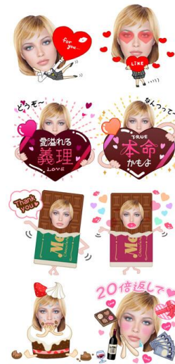
『義理義理バレンタイン』