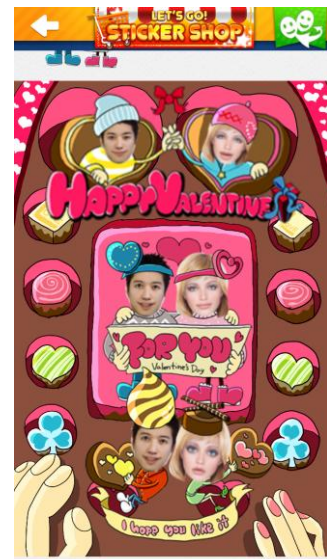
生成されたスタンプから、 送りたいものを選択