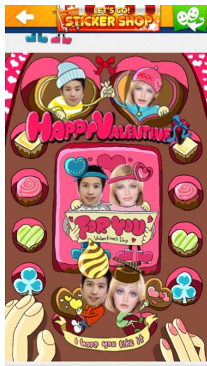
『チョコでラブな俺ら』