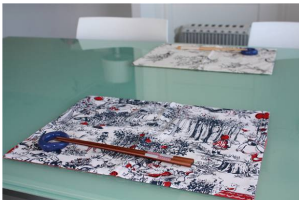
●ランチョンマット ¥1,470