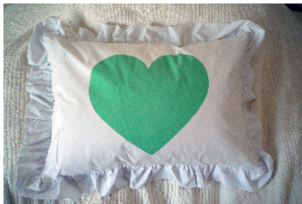
●ピローケース (大) ¥6,930