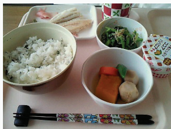
普通の箸だと食卓がさびしい