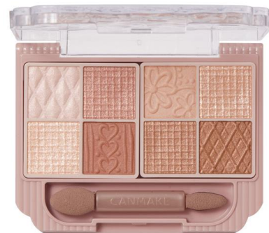
04 アマンドブリュレ

持ち歩くのが楽しくなる！ クラッチバッグをイメージした容器や 洋服の生地や柄をイメージした 可愛い型押しデザインもポイントです♡