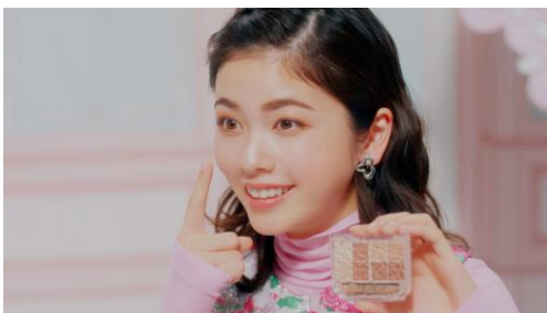
5. 「プティ？」 「ウィ、プティ！」