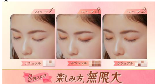
4. コンパクトサイズなのに、8色入りで、楽しみ方、無限大！