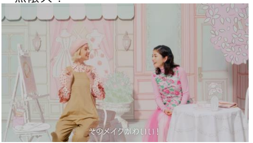
6. オープンカフェでお茶していたら、お揃いのパレットでアイメイクをしているフランスの女の子と意気投合！