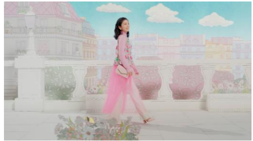
2. 春の陽気に誘われてお出かけを楽しんでいます。