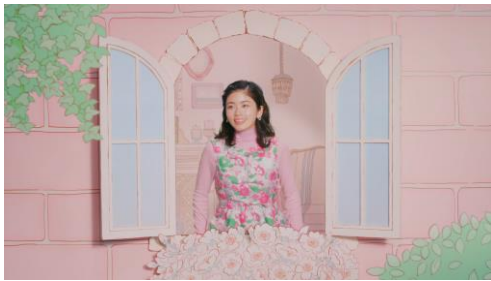
1. イラストで描かれた窓から顔を覗かせる小芝さん。