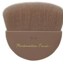
マシュマロフィニッシュパウダーブラシ ¥528 (税込)

肌当たりなめらかな、毛量たっぷりラウンドブラシ。 マシュマロフィニッシュパウダーシリーズのコンパクトに 収納できる！