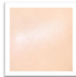
仕上がりイメージ