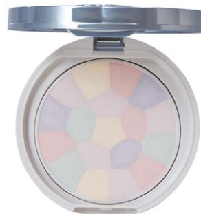
01 ハイドレンジアガーデン