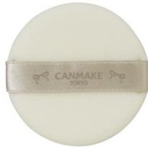
ふわっふわな専用パフ付