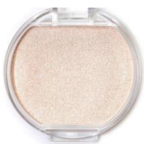
01 ムーンライトジェム