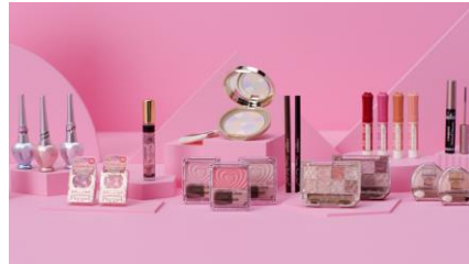
CANMAKE歴代商品（周年ブランドムービーより）