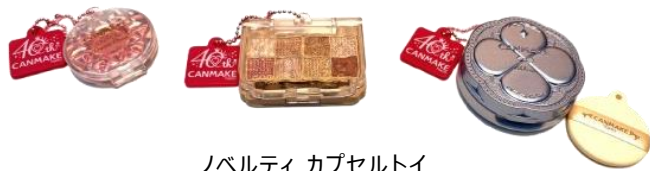
ノベルティ カプセルトイ