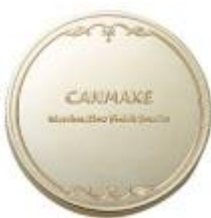
2021年～ 発売10周年を記念して、 大人可愛いデザインに！