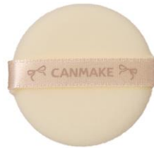
肌あたりの良いパフ付