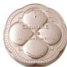
2023年～ 限定発売のパッケージが 評判を呼び、定番化へ！