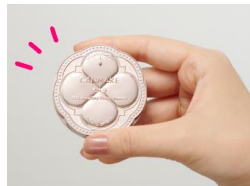
容器のデザインはそのままに、サイズだけminiになりました♡