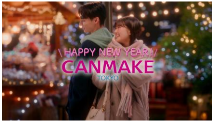
HAPPY NEW YEARバージョン

新春限定、「HAPPY NEW YEAR」バージョンの キュン♡とするラストカットにもご注目ください！