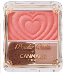
P06 ジューシーコーラル