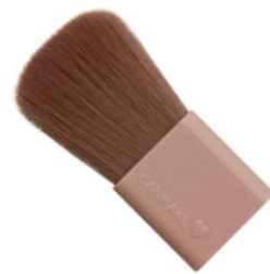
毛量たっぷりのふわふわブラシ付