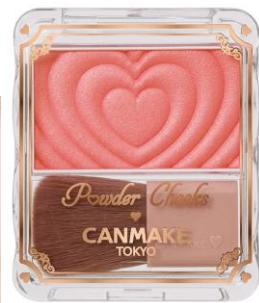
P06 ジューシーコーラル