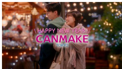
HAPPY NEW YEARバージョン