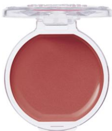
21 タンジェリンティー