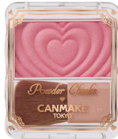
<40周年記念カラー> P40thx キューティーベリー