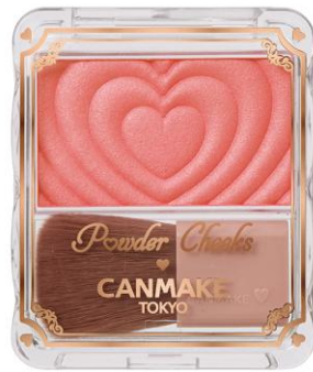
P06 ジューシーコーラル