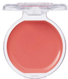
05 スウィートアプリコット