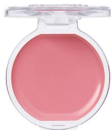
23 キュービッドピンク