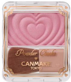
P05 クラッシーモーヴピンク