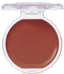
16 アーモンドテラコッタ