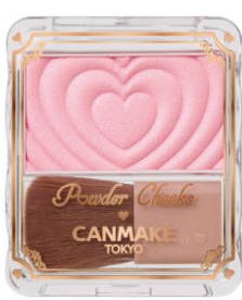
P02 リトルシャイピンク