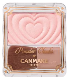
P04 クレバーベージュ