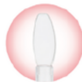
先細なスパチュラタイプ