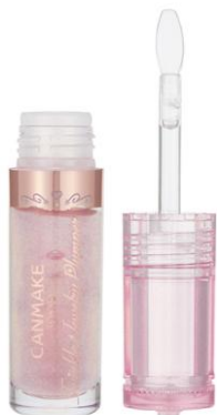
01 トウインクルピンク