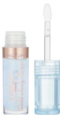
02 トウインクルブルー