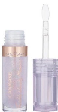
03 トウインクルパープル

それぞれの色みに合わせて、 容器のカラーもチェンジ！ クリアでキュートなデザイン♡