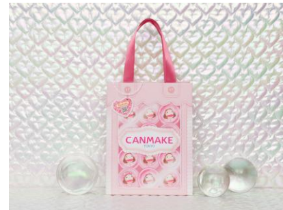
オリジナルショッパー

4) キャンメイク商品2,500円(税込)以上のご購入 「オリジナルショッパー」をプレゼント +「選べる！カプセルトイ」※にチャレンジ +「ホログラムポーチ」プレゼント！