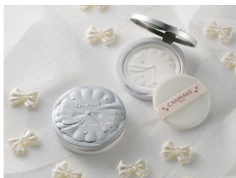
クリアヴェールセッティングパウダー 01