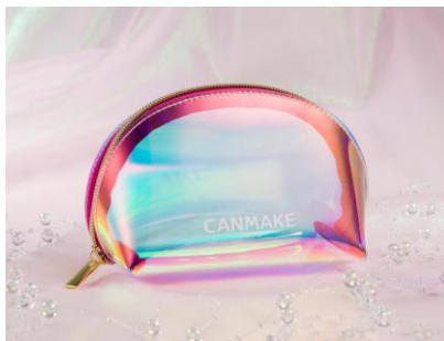
ホログラムポーチ