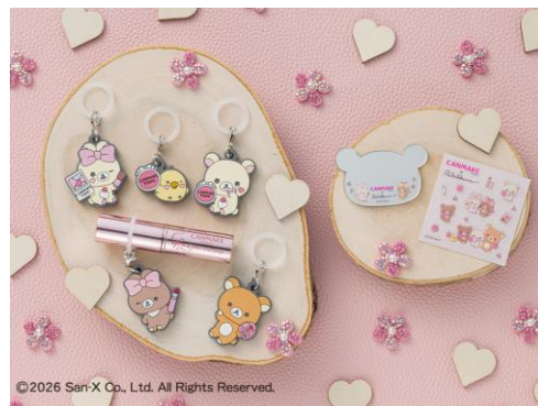
キャンメイク×リラクマ ノベルティ