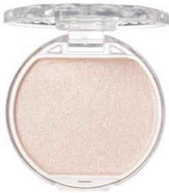
01 ムーンライトジェム

★ <先行> 05 アメジストブルーム：儚さのある上品な白みパープル [シルバー・ブルー・レッド・ブルー偏光・パープル偏光のパール配合]