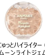
むにゅっとハイライター 01 ムーンライトジェム