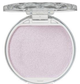
05 アメジストブルーム