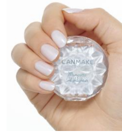
※仕上がりイメージ