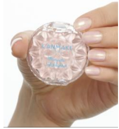
※仕上がりイメージ