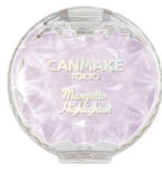
05 アメジストブルーム