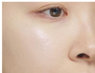
※仕上がりイメージ

新色05は、ピンクにより過ぎない、ほんのりと白みを含んだやわらかなパープルです。シルバー・ブルー・レッド・ブルー偏光・パープル偏光のパールを配合。透明感をプラスしながら繊細にきらめいて上品に仕上がるので、大人の肌にもぴったり。寒色でも暖色でもない色みだからパーソナルカラーや季節を問わず、使いやすいカラーです♡