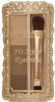
01 ナチュラルブラウン